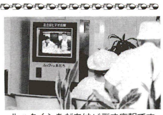
ルックインあだちはビデオ広報です

○小・中学校は各校1種目3人以内とする。(リレー、ファミリーリレーを除く) ○1人2種目までとし、小・中学生は1人1種目とする。(リレー、ファミリーリレーを除く) ○小・中学生の参加は、通学している学校でまとめて申し込む。 ○年齢は大会日とする。 ○☆は墨東五区大会予選種目。