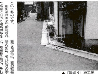
▲「隅切り」施工前 ▲「隅切り」施工後

「存ぞく」保険料の免除制度 「存ぞく」保険料の免除制度。道路を守る月間。道路を守る月間。道路を守る月間。