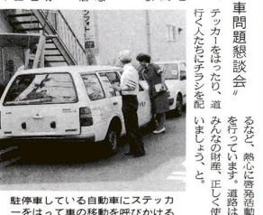
駐車している自動車にステッカーをはって車の移動を呼びかける

「みどり」を愛するみなさん、苗木をプレゼントしてあげよう。苗木をプレゼントしてあげよう。苗木をプレゼントしてあげよう。