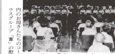
美しい歌声にみんなうっとり

スタンプを集めながら2時間半で、約7kmの道のりを元気に歩きました。参加した子供たちは、自力で完歩した証(あか