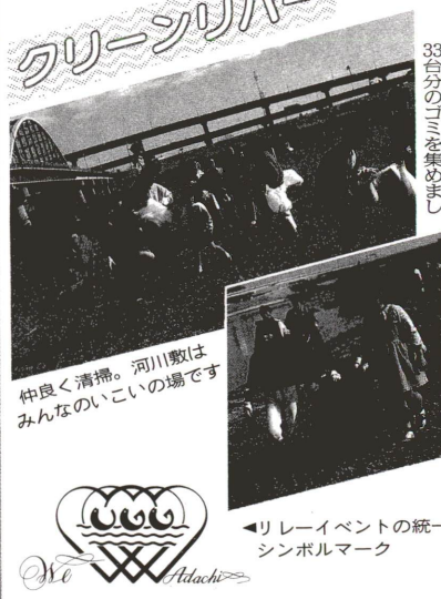
仲良く清掃。河川敷はみんなのいこいの場です