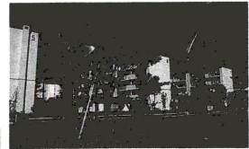
扇彫刻のある公園

発行/東京都足立区 千120 足立区千住一丁目4-18 ☎(3882)1111 編集/企画部広報課