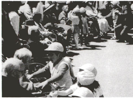
家賃助成の所得基準額表

民間の賃貸住宅に住んで、いる高齢者世帯の方が、家賃から転居を求められるなど、転居に困ったとき、家賃等の助成が受けられるのは、取り壊しのため立ち退きを求められている世帯