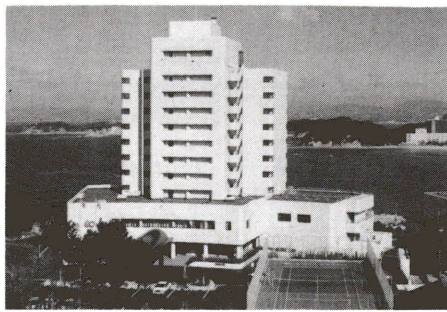
全国各地のリゾート施設が格安で利用できます

サービスセンター「くわ」額出資で設立されました。(財団法人足立区勤労福祉 勤労者の会員の共済ササビセンター)は、ワ スタムとして、区内2700 サラシの豊かな余暇を 事業所 7千人が「くわ」 応援するため、足立区の全 の会員となっております。