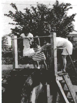
身近に豊かな自然を

「財団法人水と緑の公社」が4月1日スタートしました。企画でもはじめていうユニークな名称のこの公社は、水と緑の豊かな都市環境づくりの一翼を担う公社です。環境問題は、これから深刻へかけて、全地球、全人類の課題であり、その意味で現代的なテーマである公社の発足です。