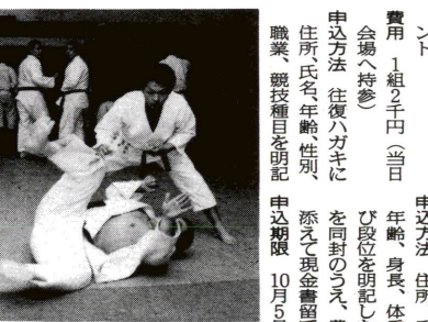
今年も熱い戦いがくり広げられます

第44回 区民体育大会 日時 10月21日(月)、午前9時～午後4時 前日 10月20日(日) 場所 平野運動場 対象 区内在住・在勤の方で編成する18人のチーム 費用 1チーム3000円 申込方法 申込書(住所、氏名、年齢、身長、体重および段位を明記したもの)を同封のうえ、費用を添えて現金書留で郵送 申込期限 10月5日必着