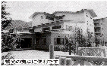
観光の拠点に便利です

日光と塩原の林間学園を一般開放します。ぜひご利用ください。 対象 代表者が区内在住・在勤の2人以上のグループ(未成年者のみの利用は不可) 日 3月30日迄 申込・問合せ先 本庁舎(千住・校外学園係) ☎3890-1111