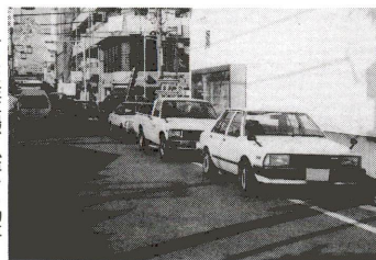
町には駐車場が必要な自動車があふれています

東京都特別区内に、駐車場を整備する方が、建設に必要な資金の融資あっせんおよび利子補給をする制度がスタートしました。この制度は、民間での駐車場建設を促進し、道路交通の円滑化と都市機能および都市環境の向上を図ることを目的とした制度です。 ●融資あっせん 対象者 東京都特別区内に駐車場を整備し、継続して事業を営む方で、确实な事業計画および返済能力を有する方 ●融資あっせん 貸付利率 年4.0% 貸付期間 15年以内(借置期間1年を含む) 貸付対象費用 標準工事費用(取得費を除く) 貸付限度額 1台につき500万円以内。ただし、道路等の地下を利用する場合は1台につき1千万円以内 ●融資を受け方は、金融機関の求める担保を提供することになります。 ●取扱い金融機関 区内の都市銀行・長期信用銀行・信託銀行 申込・問合せ先 本庁舎(千住)・駐車場対策係 ☎(3880)1111 融資あっせんを受けた駐車場のうち、駐車場整備地区内およびそれに準ずる地区内の駐車場で、5分の3以上が時間貸しの駐車場(補給率 年1.0%以上)で、道路等の地下を利用する都市計画駐車場は、年2.0%の範囲内 ●申込必要書類 融資あっせん 駐車場整備基金融資あっせん申込書 ▽建設資金計画書 ▽建設工事見積書 ▽増設または、建替の場合に既存の駐車場の写真、配置図および平面図(▽建設図面(平面図および立面図)▽その他必要書類) ●利子補給 融資あっせんと同様の書類と、▽駐車場整備基金利子補給交付申請書