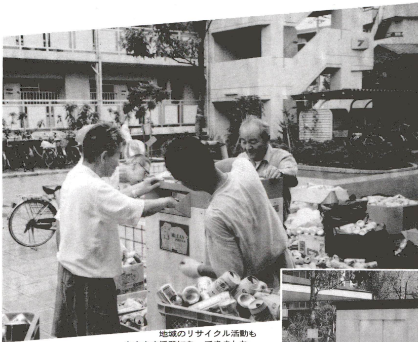
地域のリサイクル活動もますます活発になってきました 貸し出し用空き缶プレス機も活躍中です