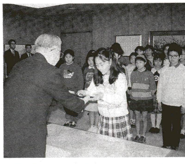
またこのほか10団体15人の個人が、あだち教育委員会賞を受賞しました。《教育委員会》