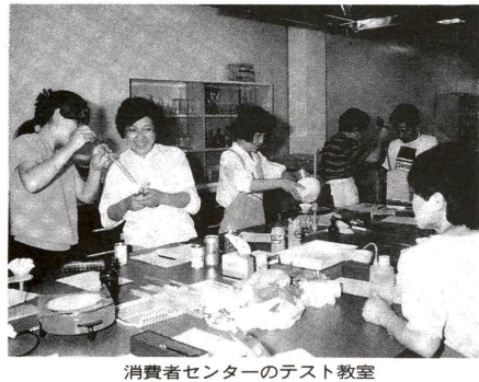
消費者センターのテスト教室

参加しませんか 消費生活問題 調査研究 グループ 夫の酒乱、暴力行為や困窮している女性の方の相談を受けています。 消費生活上の身近な疑問について調査研究するグループを募集します。 最近の新聞テレビでは機能性食品の効果や輸入食品の安全性について、取り上げられています。また、「民間と地球環境問題」がテーマで、私たちが消費者自身が、この問題に関与し、学びあいたいという問題です。