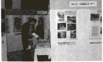
北千住C1シンポジウム 産業振興館 常盤新線を北千住のまちづくりにとど生かすか考えました。