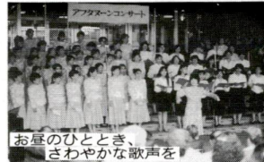
お昼のひととき、さわやかな歌声を

出演団体 ▷第1部…マミーコーラス・ボナ ▷第2部…ロートスブルム 演奏曲目 ▷第1部…水のオルゴール、夏の思い出、野菜サラダ物語 ▷第2部…浜辺の歌、菩提樹、てんとう虫のサンバ 問合せ先 本庁舎(千住)・文化振興係 ☎3882-1111(代)