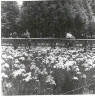
およそ40種のしょうぶが 見られるしょうぶ沼公園