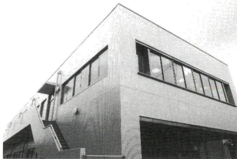
地域とけこんだ福祉施設に

東綾瀬一丁目、東部福祉事務所、綾瀬福祉園（精神薄弱者更生施設）、肢体障害者作業所の3施設が入った新しい建物がオープンします。これは、区が進める「元氣あふれる生活を支えるしくみをつくる」ため、足立区福祉総合計画に基づき建設しました。障害者の社会参加や情報の提供、また地域福祉の窓口として、新たな役割を担っていきます。