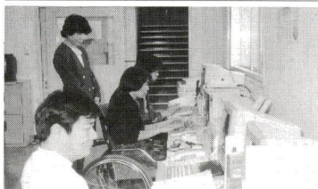
「あいネット21」の画面もここで作る予定です

●綾瀬福祉園（精神薄弱者更生施設） 重い知的障害者の自立促進のため、生活指導、作業訓練を行います。新規開設。 ●肢体障害者作業施設 千住曙町から、肢体障害者作業施設「楓作業所」および「ソフトウエアシステム」を移転してきます。 ●東部福祉事務所 東綾瀬1-5-17の東部センター隣接地から移転してきます（電話、FAX番は従来通りです。生活保護に関することや、身体障害者、精神薄弱者、高齢者、母子世帯、児童などの福祉向上をはかるため、各種の相談などを行っていきます。） ●東部福祉事務所 問合せ先 東部福祉事務所 〒120-0007 1-5-17 FAX 509-6000