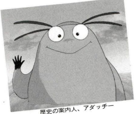
歴史の案内人、アダッチー

興味のある、なしにかかわらず、その地に住む人の生活に郷土の歴史は深くかかわっています。しかし、新しい道路や建物が次々とつくられる今日、私たちに歴史を語りかけてくれるものは少なくなってきています。また、比較的新しく区民となった方には、区の歴史はなじみが薄いかもしれません。 足立が区となって今年で60年、区ではこれを記念して、これまでより詳しくみやすい形で区の歴史を紹介するものを制作しました。これ1冊で足立の歴史がわかるという「絵でみる年表 足立風土記」昭和46年を以てした「足立の昭和史」、子供にもわかりやすく区の歴史を描いたアニメ「おーい! アダッチー」。これらとともに、秋の一日を足立の今と昔に遊んでみませんか。