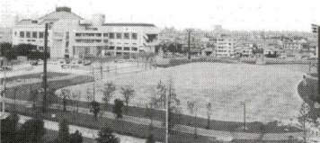
様々なスポーツが楽しめます

総合スポーツセンター。また、散策や憩いの場との隣りに、少年野球、サッカーなどが楽しめる広場です。 内歩道にはジョギングコースもある多目的広場の公園がオープンします。スポーツ大好き人間、これからスポーツを楽しむという方にはもってこいの公園です。