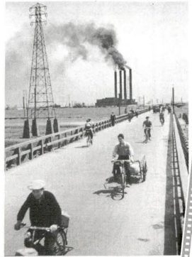
なつかしい足立の風景—おほけ産案—