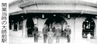
開業当時の大師前駅