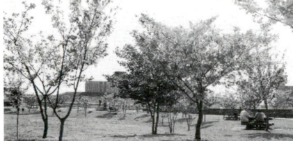
都市農業公園の八重桜

桜は区役所の のソノボレで す。区内では 寒桜かツメ イソノ、ハ 重桜さまざま な花を見 ることができ ます。このほか 合川(荒 川の五橋)に 代表される 八重桜を見学 します。