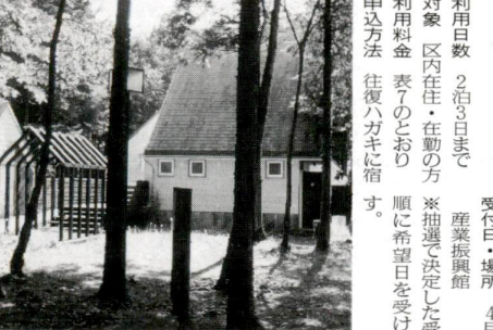
鹿沼野外レクリエーションセンターのバンガロー