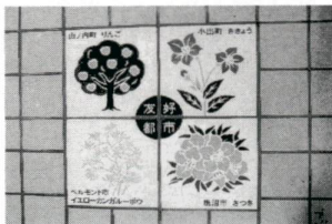
こんな楽しい絵タイルがいっぱい

3月27日正午の開通を先立ち、午前10時30分から午後10時30分まで、橋の渡り初めを行います。また、舎人1号公園（入谷九丁目29）では、入谷大橋開通を祝い、仮面ライダーZOSHIOやふれあい動物園など楽しい催しがたくさん行われます。下表示態をぜひ、おいでください。問合せ先、記念フェスティバル実行委員会事務局（舎人区民事務所） ☎(3889)4014