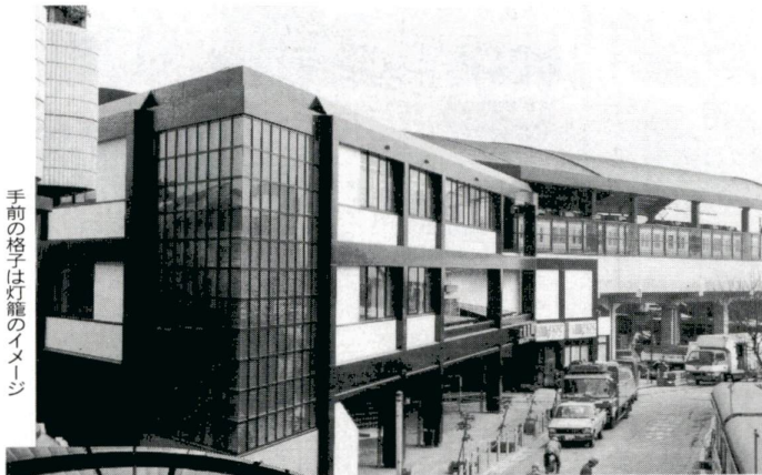
手前の格子は灯籠のイメージ