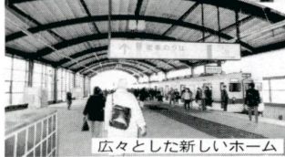
広々とした新しいホーム