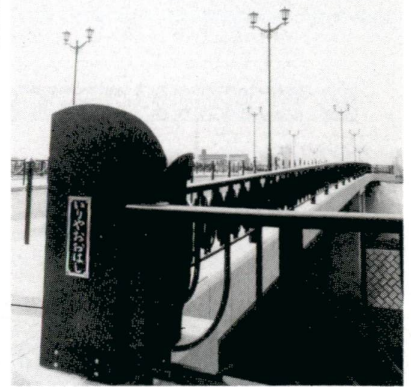
レトロな街灯が印象的

1時間に約千台もの自動あり、歩行者の小さな憩いの場ともなっています。車が行き交う南平大橋（入谷八丁目）も、足立区が完成します。このため足立区川口市双方の日常生活に支障をきたしてはなりません。