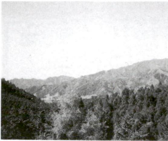
新緑のまぶしい5月の日光

日時 5月16日(日)、午前8時30分 場所 東武日光駅改札口左側コンコース集合 対象 鳴虫山(日光国立公園) 対象 高校生以上65歳以下の区内在住、在勤、在学の方 費用 500円(当日持参) 申込 8ヶ月前(住所、氏名、年齢、性別、電話番号を明記) 期限 5月10日 申・問先 山岳連盟事務局・荒川市郎 千住本木 2-26-12 ☎3880-5385