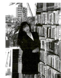
たくさんあって迷ってしまいます

公開の対象となるのは、役所の職員が職務上作成したり国や都から取得した文書、図画、写真を、これらは原則としてすべて公開されます。