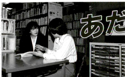
もっと区の情報を役立ててください