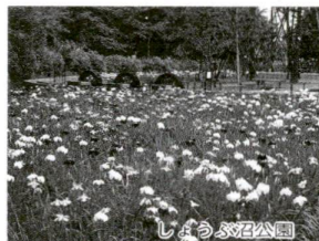
しょうぶ沼公園 期限=5月31日必着 申・問先=千住本庁舎・広報課 〒120千住1-4-18 ☎3882-1111(代)

日時等=下表のとおり 内容=東京武道館、しょうぶ沼公園、郷土博物館、花畑記念庭園桜花亭など、区内の公共施設をバスで巡ります 費用=無料 申込=往復ハガキに参加者の住所、氏名、年齢、電話番号、見学希望日および「施設見学会希望」と明記(往復ハガキ1枚につき2人まで申し込み可)