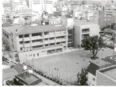
千寿本町小学校(地下に千住温水プール「スイミー」があります)