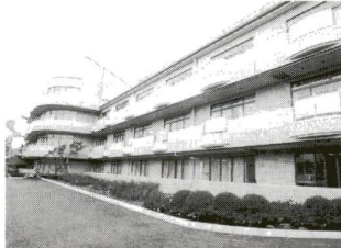
区内で4番目の特別養護老人ホーム「ゆうあいの郷・扇」