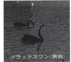
ブラックスワン(黒鳥)