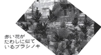
赤い花がたわしに似ているプランシキ