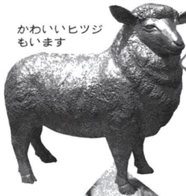
かわいいヒツジもいます