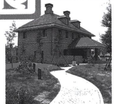
ロマンチックな赤レンガの洋館