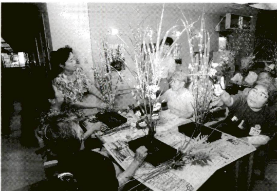
いつまでも元気に暮らせるまちづくりに取り組んでいます。「ゆうあいらんど・さの」の生け花教室