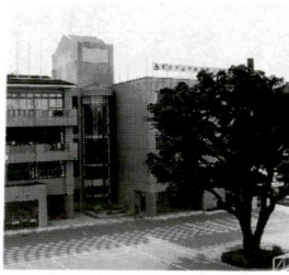
会場となる千寿本町小学校上と千住宿歴史プラザ