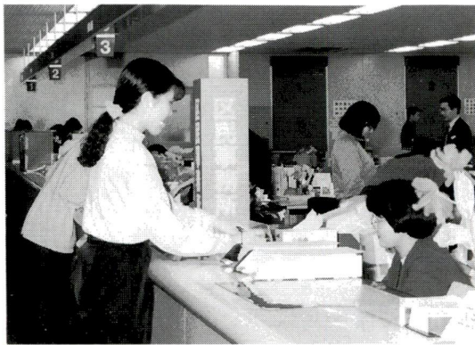
図1 土曜日に住民票(写し)を受け取る方法

「月末までにこの証明書が必要なのに、忙しくて区役所に行けないナア、どっしりよ...。そいつうときのために、区ではいろいろなサービスを行っています。これらのサービスを上手に利用してみませんか。」