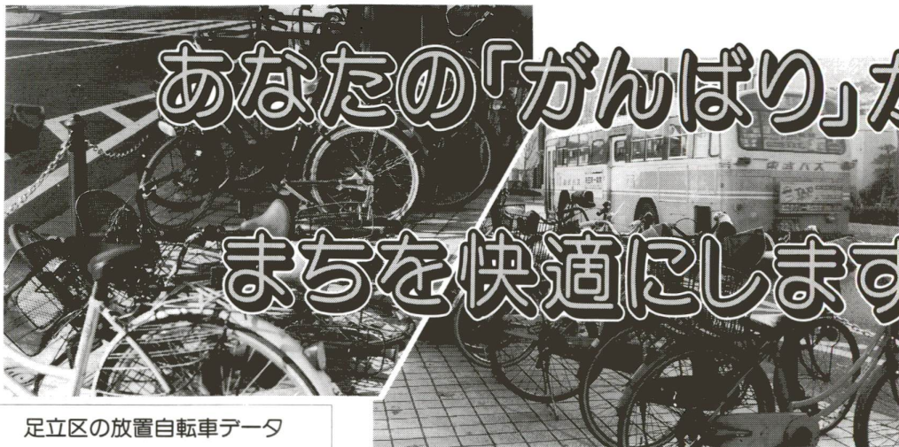
無造作に放置された自転車(竹の塚駅周辺)