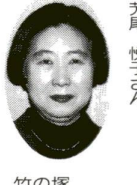
竹の塚 四丁目在住

初々しい青春時代を思い出します、そんなやさしさのある曲です。大人たちだけではなく、ぜひ、子供たちにも覚えてもらい、この曲が日本の各地からも聞かせるようにしたいですね。