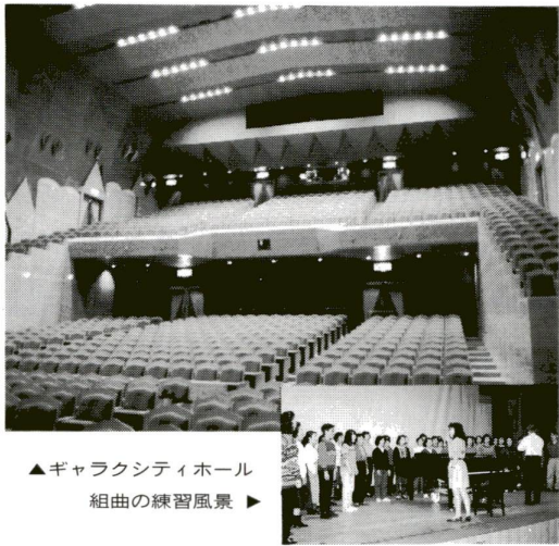
▲ギャラクシティホール 組曲の練習風景▶

区制60周年を記念して制作した、管弦楽と合唱のための組曲「わが街に」。これは、足立をきたる組曲です。作詩なかにし礼さん、作曲團伊玖磨さんといった、日本音楽界を代表する方の作品であるこの組曲を、ギャラクシティのオーケストラと合唱団が、親しみやすい曲のつた流れるような美しい歌声……。きつと心に響く心で聴いてほしいでしょう。