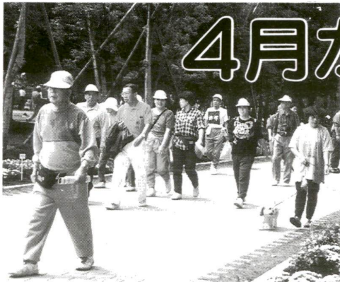
健康づくりの第一歩は、自分の 身体の健康状態を知ることです

がん 、心臓病、脳卒中。この3大成人病が足立区民の死因の6割以上を占めています。区では、これら3大成人病をはじめ、肝臓病や糖尿病などが発見できる健診を用意しています。 健康づくりの第一歩は、自分の身体の健康状態を知ることから始まります。年に一度は健康診査を受けて、自分の健康状態をチェックしてください。 成人健康診査は、心臓、肝臓、腎(じん)臓の病気や糖尿病、高血圧、高脂血症等について調べる基本的なものです。血圧はもちろんです。コレステロールや血糖など9項目も血液検査をはじめ、必要な検査も行います。 区民の皆さんは無料ですが、区の負担額は1回あたり約1万2千円以上(平成4年度実績)です。こんなに内容が充実した健診を、ぜひ受診してください。申し込みは、4月から受け付けます。 成人健康診査 胃がんと大腸がん検診が同時にできます。4月から受けやすくなるため人数を増し、次の点を改善しました。 ▽お力所すべての保健所、保健相談所で受診できます。