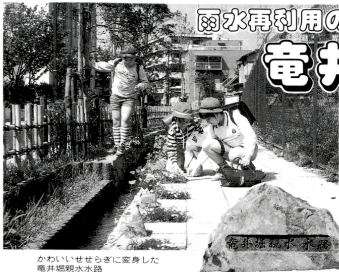
かわいいせせらぎに変身した 竜井堀親水水路