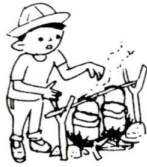
キャンプセミナー日程

今年も国際家族年です。今回はみんなで楽しむ野外活動をテーマに、様々な可能性を考えます。日程等 対象 16歳以上で青少年育成活動にかかわっている方 費用 無料(実習費は実費) 申込 電話 期限 5月20日 申・問先 千住本庁舎・少年育成係 〒120千住1-4-18 ☎(03)3882-1111(代)