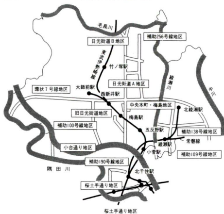
図1 不燃化促進区域図

区では、「災害に強いまちづくり」の一環として、大震災時時の安全な「避難路」や「延焼遮断帯」を整備するため、不燃化促進事業を行っています。この事業は、不燃化促進区域内で事業実施期間中、一定の基準に満たない不燃建築物を建て替える方に工事費の一部を助成し、建物の不燃化を促進するものです。 現在、左図の12地区で助成事業を行っています。この区域内で建物建て替えをお考えの方はぜひ、この制度をご利用ください。なお、建築工事費手当てで助成申請が必要となりますので、助成申請が必要となりますので、ご注意ください。 ※不燃化促進区域とは、指定路線の道路の両側からそれぞれ30m以内の区域、お