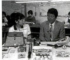
「まち工場」から様々なアイデア商品が生まれています