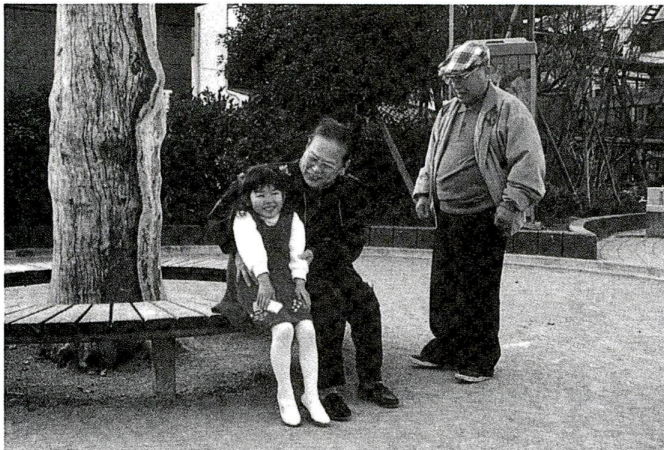
住み慣れたまちで暮らせるようさまざまな施策に取り組みます

平成7年度から9年度の区政推進の柱となる「足立区総合実施計画」がまとまりました。この総合実施計画は、21世紀の足立区の将来像「ときめき ゆとり 水辺のまち 足立」の実現を図るための「第三次基本計画」に基づく2年目の実施計画です。計画は、社会・経済情勢の変化などに弾力的に対応できるように、3年間の中期計画とし、事業の推進に合わせ毎年改定していきます。計画の3つの大きな柱である「まちづくり」「地域保健福祉」「コミュニティの形成と生涯学習の推進」の各施策に従って、主な計画事業をお知らせします。