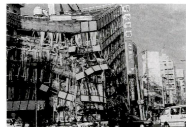
1月20日、神戸市内にて広報課撮影

1月17日、午前5時46分、兵庫県南部地震が発生し、多数の死傷者と被害が出ました。被災者の方々には、心からお見舞い申し上げます。折しも昨年の同日には、アメリカ合衆国サンゼルスでノースリッジ地震が発生。これらはいずれも、都市部で起きた直下型地震です。関東地方においても、このような直下型地震の発生が懸念されています。地震の発生を止めることは誰にもできませんが、その被害を最少限に食い止めることはできます。そのためには、「災害が起きた時どうするか」を考えた上で、常に準備しておくことが、その要といえます。区でも、これを機に防災計画を見直すことになりました。区民の皆さんも、ぜひこの機会に、災害に備えて自分の身の回りを直視してみてください。