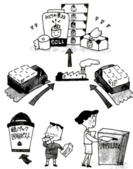
▲皆さんから回収した資源で作られます