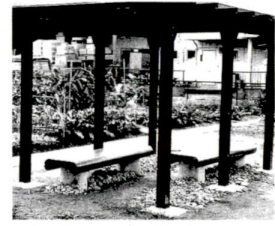
▶作業のあとにご利用ください

区民農園は区内約50ヶ所、263区画あります。11月10日現在1区画は約4坪、家庭菜園にはちょうど良い広さです。この4坪の土地から、夏はトウモロコシ、秋はサツマイモ等の四季折々の作物が生れます。何を育てるかはあなた次第。自分で作る新鮮な野菜をあなたの食卓で味わってください。