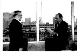
行政改革推進委員会 審議の様子

簡素で効率的な区政の確立と 区民サービスの拡充を目指して 「第二次行政改革大綱」をまとめる 行政改革推進委員会 審議の様子 行政改革推進委員会が、第二次行政改革大綱をまとめる。大綱は、簡素で効率的な区政の確立と、区民サービスの拡充を目指している。大綱は、行政改革推進委員会の審議を経て、最終的に決定される。