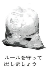
ルールを守って出しましょう

●今回の有料化での程度のごみ ボランテアシールの対象ですが、その申請・交付するのには大変です。少量の場合は家庭ごみと一緒に出すこともできますので清掃事務所にご相談ください。