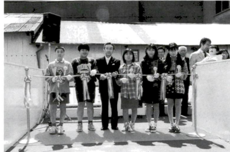
▲さくら橋でのテープカット