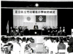
▲竹の塚北小開校式

4月に統合新校の桜花小と西保木間小が開校しました。そのため、桑袋小と花畑東小、また竹の塚北小と湖江第一が開校することになり、3月25日各校で閉校式が行われました。 また同日、桑袋小の子どもたちが毛長川を渡って安全に桜花へ登校するための人道橋、さくら橋の渡り初め式もありました。花畑北中フラスバンド部の演奏が流れるなかテープカット。その後、4月から同じ学校の仲間になる桑袋小と花畑東小の子どもたちが、橋を渡りつつ、仲良くしようねと笑顔で握手をかわしました。