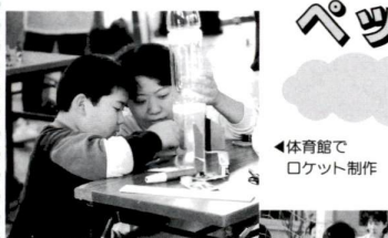
◀体育館でロケット制作