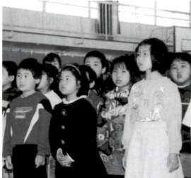
▲思い出深い校歌を歌ってお別れ(桑袋小)

毎年続けて10年目 老人会館でコンサート 3月8日、老人会館ですみれコンサートが開催されました。これは、第十四中学校のマンダリン部の皆さんが毎年行っている演奏会、今年で10回目になります。歌詞カードも配られ、最後の曲「月の砂漠」は、会場の皆さん大合唱になりました。