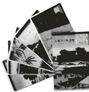
浮世絵の絵ハガキも販売中

資料の展示を初め、講演や講演会の開催、研究報告書の発行など、さまざまな方法で足立の歴史を紹介している郷土博物館。 展示を見るだけではなく、何か歴史について調べたいのことがあるときも、博物館の情報資料室へどうぞ。足立区の郷土資料を初め、全国自治体・博物館の歴史書・報告書など約2万冊と、伝統技術や祭りについてのビデオも揃っています。 そんなことが調べたいのだけれども、なかなか本を見ればいけません。資料の探し方についての相談も受け付けています。