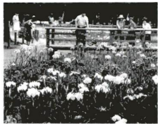
谷中2-4-1 (北綾瀬駅下車徒歩1分)

しょうぶ沼公園では、6月中しょうぶ田を開放しています。梅雨の晴れ間に見にいきませんか。