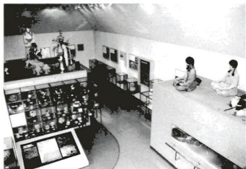
出土物が紹介されている展示館

伊興遺跡は都内でも珍しい古代祭祀遺跡です。この遺跡は、神をまつり、豊かな稲作を祈っていた様子が見られる出土物が多いことが特徴です。