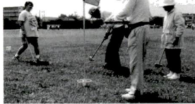
子どもたちと楽しく～三世代グランドゴルフ～

今年、区内では男性4人、女性8人の12人の方が、白寿(99歳)を迎えました。9月8日から11日までの間に区長がそれぞれのお宅を訪問しました。 「長寿」と記念の品、区内の和裁サークルが手作りの茶色い「チャンチャン」を贈り、長寿