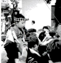
10年後は、ワタンたちにまかせてね～(第七地域まつり)