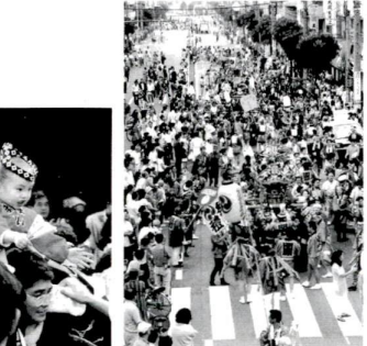
街中総出で大にぎわい(第七地域まつり)