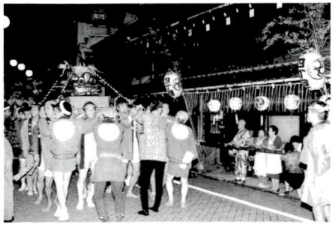
宿場町の面影を伝える旧街道にて(千住本町五可会)