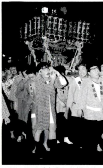
万灯の明りが夜目にも鮮やか(千住祭連)