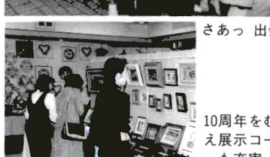
さあつ 出発!! 10周年をむかえ展示コーナーも充実