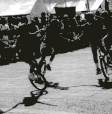
一輪車が、オープニングを盛り上げる