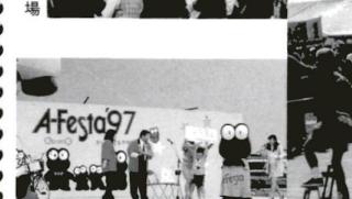
北千住駅西口ひろば会場 A-Festa'97 フィナーレでの大抽選会「当たったよ」と大喜び