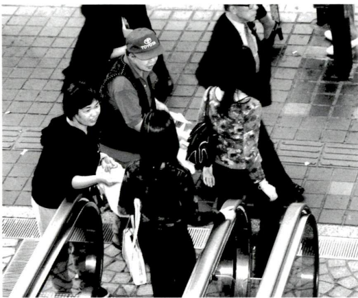
10月25日に行われた街頭PR活動（北千住駅前）