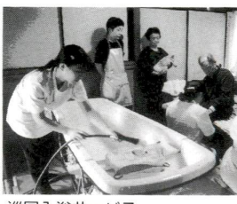
巡回入浴サービス

自宅に特殊浴槽を持ち込み入浴する方法です。年32回を限度に委託業者が入浴のお世話をします。ご利用の際には、家族等の立ち会いが必要です。