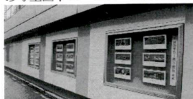
千住壁面の道ギャラリー

◆千住宿歴史プチテラス(千住河原町21-11) ▷1日～4日...パッチワーク ▷6・7・13・14・20・21・27日...やっちゃ場の風俗展 ◆千住壁面の道ギャラリー(千住旭町42) ▷1日～15日...働く消防の写生画 ▼16～31日...水彩画ほか