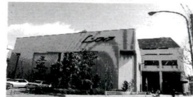
消費者センターはエル・ソフィア内です

申請者が用意してください 講師費用=消費者センターで負担(限度額あり) 申・問先=消費者センター ☎3880-5385