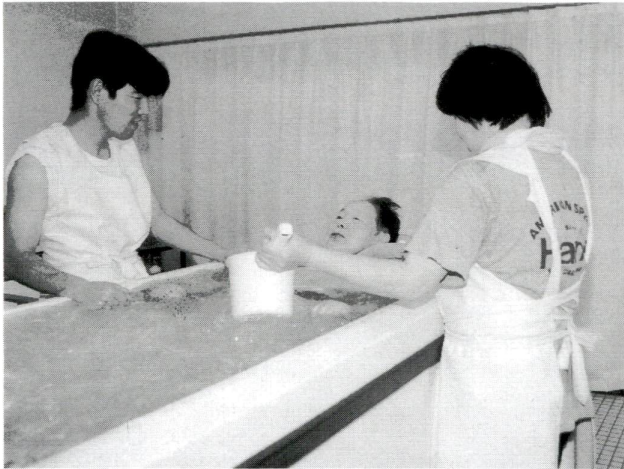
高齢者が在宅サービスセンターでの入浴サービス