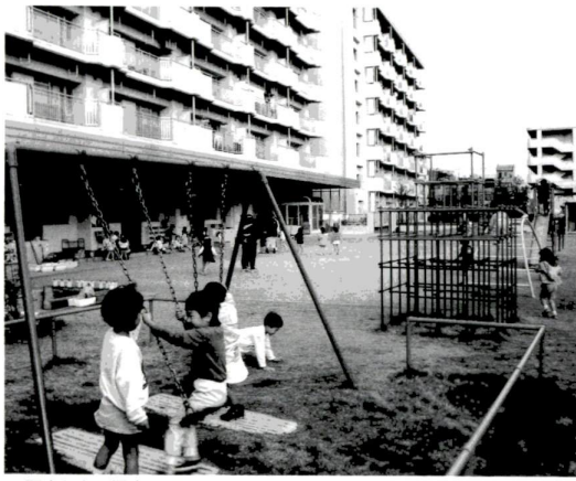
▲区立やよい保育園