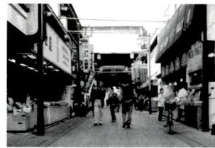
▲西新井大師商栄会地区カラー舗装化

区では、区財政の実態を皆さんに正しく理解していただくために、財政状況を年2回、6月と12月に公表しています。今回は9年度上半期の執行状況等についてお知らせします(図表は9年9月30日現在のものであります)。