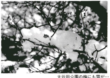
大谷田公園の梅にも雪が...