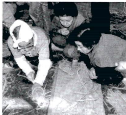
最後の仕上げを教わります