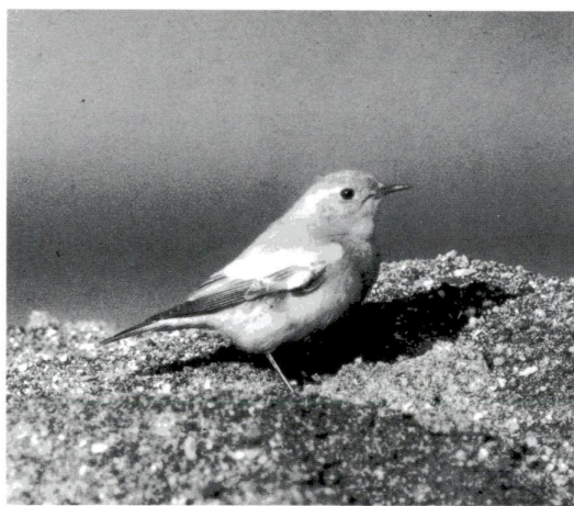
2年ぶりに確認されたサバフヒタキ（メス）

区では、環境保全対策の一つとして、身近にいる生き物を把握するために野鳥と魚の調査を行っています。鳥類は荒川で夏と冬に昭和59年度から、魚類は秋に区内5河川で昭和54年度から行っています。