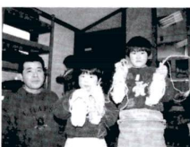
わらぼうりができたよ!