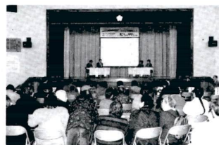
あたたかてオアシス!