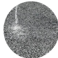
どんどんしみ込む透水性歩道