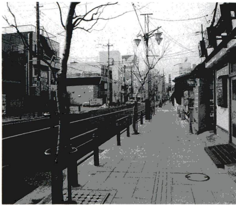
3月に完成した竹の家東口商店街の道路改良工事で、歩道がカラー化され、おしゃれな街路灯も設置されました

●発行/足立区 〒120-8510 足立区中央本町1-17-1 ☎3880-5111(代) 編集/企画部広報課 FAX 3880-5610 ●あだち広報は毎月10日・25日/エクスプレスは奇数月1日発行