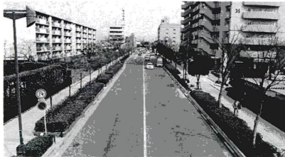
電線・電柱のない竹の家の駅前通り(東口)