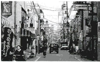
千住緑町商店街「ゆうやけ通り」

商店街の活性化と景観の向上を図るうえで、歩道のカラー舗装はとても効果的です。しかし、カラー舗装は通常の舗装に比べて車輪が高く、車イスや高齢者の方にとって、歩きにくい面があります。