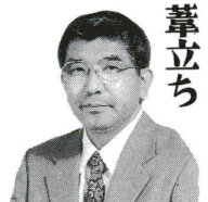
区民の声(広聴ハガキ)

区には広聴の仕組みとして世論調査やモニター制度、区政を語り合う会、そして区民の声等があります。区民の声(広聴ハガキ)は、毎年たくさんの声が寄せられます。昨年度は前年の声が寄せられました。意見や要望が30件程、苦情が20件、感謝の言葉もいただきました。 お寄せいただいた区民の声は、それぞれの担当へ回答され、その結果がの手元へまいります。また、区の仕事でないものについては、都や国等の機関にその内容を伝えて、回答をお願いするという方法をとっています。その中で実施に移せるのは速やかに実施に移しています。昨年度のご意見(要望)の中で、提案の一部を実現したのもも含め、実施に移したものは40件を越えます。この制度を利用して、区民と行政のキャッチボールがさらに活発になることを期待しています。 今年度から、あだち広報10月号に「みんなのページ」を設けましたが、これは昨年度寄せられた区民が参加できる広聴紙をという意見に応えたものです。エクスプレスの「読者のページ」と同様に皆様の交流の場としても青空のご要望を大切に思っています。