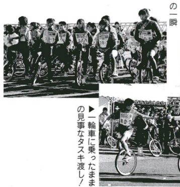
▲スタート前の緊張の瞬間