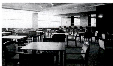
▲南館14階の展望レストラン