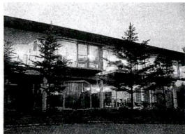
▲国民宿舎軽井沢高原荘

熱川、犬伏、野井沢など11カ所の国民宿舎の宿泊料が無料で利用できます。ただし、入湯税や季節による特別宿泊料金の差額等は自己負担になります。また、今年度から区施設の利用も、新たに野外活動施設も力を所を、新たに指定しています。年度内国民宿舎と区施設との合計で1人2泊まで利用できます。対象：母子または父子家庭の児童育成会受給者の方 申込：国民宿舎・各施設へ直接予約 必ず足立区ひとりで親家庭休養ホーム利用と併せてください。予約後、児童手当係または各福祉事務所の窓口で、利用券の申請をしてください。各区の施設：ミニミニ文化・スポーツクラブの各施設で販売する専用