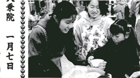
▲おいしいおかゆ「さあ、めしあがれ」

最近、家庭ではあまり作られなくなった七草がゆですが、1月7日、杉の子幼稚園(花畑四丁目)の園庭で、七草がゆの会が開催されました。園児や近所の人たち約600人が集まり、用意されたおかゆは、約40分できれいになくなりました。