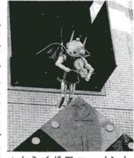
▲からくりモニュメント

ギョラクシテイ。ギョラクシテイ(銀河と、シテイ)文化ゾーンから名付けられた建物は、その名のとおり「科学館」と「西新井文化ホール」の二つの施設が同居しています。西新井文化ホールでは、本格的なコンサートや演劇などの芸術鑑賞を、こども科学館では、星の世界へ誘うフラネターリウム、迫り満点のドームシアターなど、一人であらりと立ち寄っても、あなただけの場所を訪ねてみることも、あなただけの場所をお知らせします。(広報課)