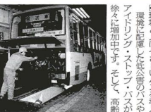
▲準備点検は欠かせません

区長褒賞受賞 おめでとう 区長褒賞受賞者のおめでとう。区長褒賞受賞者のおめでとう。