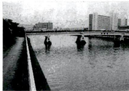
かつての「野新田の渡し」付近にかかる新田橋

第4回 新田〜江戸時代の開拓の地 新田という名前はおく内各地にありましたが、区内各地にありました。佐野新田は後の左野です。六木新田は六木となつています。いずれも江戸時代に開拓されたことを示す各町です。江戸時代の足立は約40カ村で、そのうち半数の20カ村が「新田」を名乗っていました。 現在では地名の改編に伴い、新田名を伝えているのは新田一・二丁目のみです。これは西武新田だつたところを荒川(現隅田川)