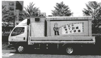
▲8月29日から活躍する新しい起震車「農太くん」

は、災害のときの迅速な初動体制を確保するため、24時間の監視体制で臨んでいます。