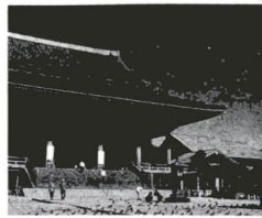
▲三が日は人で埋めつくされます

いつもの場所を訪ねて 正月の初詣はあまりに有りで、毎年大勢の人々に訪れられています。また毎月1日2日にも露店がたくさん出てくるかきです。 草園も喜ばせ、せんべいなどを売る店が軒を連ねる参道の奥に、区のある田が建てられています。山門の中を覗いて見れば、怖い顔