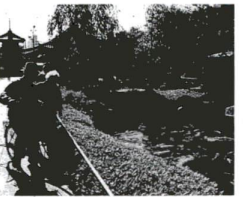
▲境内の池で悠々と泳ぐ立派な錦鯉

いつもの場所を訪ねて 正月の初詣はあまりに有りで、毎年大勢の人々に訪れられています。また毎月1日2日にも露店がたくさん出てくるかきです。 草園も喜ばせ、せんべいなどを売る店が軒を連ねる参道の奥に、区のある田が建てられています。山門の中を覗いて見れば、怖い顔