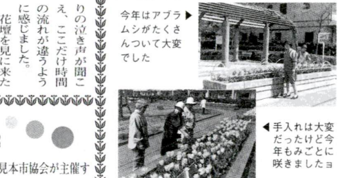
今年がたく大変な年だった アブラムシが大変な年だった

今年も河川敷大花壇のチューリップが見事に咲きました。100品種、約1万9千球ものチューリップに囲まれ、空にはひばりの泣き声が聞こえ、ここだけ時間の流れが違うように感じました。 花壇第一小2年生の女の子たちも「きれいだね」と笑顔でいっぱいでした。