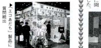
「エコあだち」製品に質問続出

「エコあだち」事務用品をPR 4月13日～16日まで東京ビッグサイトで(社)東京国際見本市協会が主催する国際環境展に足立区が出展しました。出展者は環境先進自治体や企業など約600団体。足立区は「全庁リサイクル」の取り組みを紹介。これは、本庁舎を始めとする区公共施設全体で取り組む省資源・省エネルギーシステムのことです。例えば本庁舎ではこまめな消灯などで年間3千万円を削減したり、排出する古紙を製紙原料として「エコあだち」というオリジナル事務用品を製作し、区公共施設で使っていることを紹介し、大勢の区民の方に声援をいただきました。