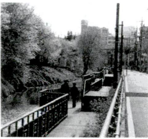
「裏門」の名称は、江戸時代に設けられていた小菅御殿の裏門に由来するといわれています。

荒川と綾瀬川を結んでいた高瀬田川。水質も良く、水もきれいで、排水路として利用されてきた使命を終えて、今では親水水路としてよみがえりました。 「裏門」の名称は、江戸時代に設けられていた小菅御殿の裏門に由来するといわれています。 水路に沿って、水面の近くに設けられた木製のデッキが続いていて、葛飾区の小菅万葉公園まで約1kmの遊歩道になっています。ここではコイなどの魚や水生植物を間近に見ることができ、休日に遊べるのがおすすめです。休日になると、親子連れや犬を散歩させる人の姿も見られます。穏やかな日には、そばに