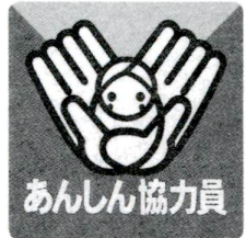
▲あんしん協力員・あんしん協力機関には、あんしんネットワークステッカーをはっています