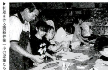
▶和風を作る西新井第一小の児童たち

区内を西から東に流れている荒川。自然を楽しむ、スポーツを楽しむなど多くの人が、憩いの場所として訪れています。 9月には、河川敷で大きなイベントが行われます。家族やお友達と一緒にイベントを見学に出かけてみませんか。