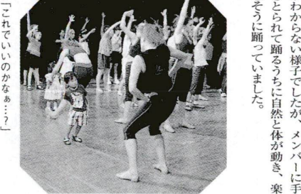
▶「これでいいのかなあ...?」