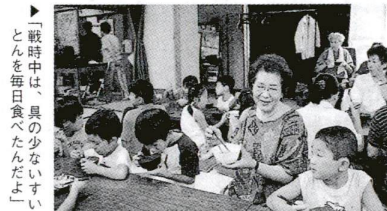
戦時中は、貝の少ないすいとんを毎日食べたんだよ