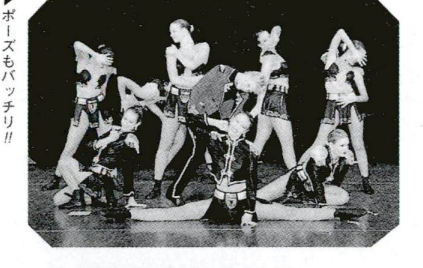
▶ポイズもパッチリ!!