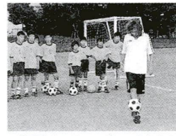
▲華麗なリフティングに、少年たちの熱い視線