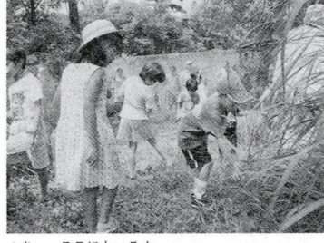
▲あつ、ここにもいるよ

夏休み恒例となっている「バッタとり大会」が8月19日(土)20日の2日間、生物園で行われました。近年、野原などが減り、子どもたちが虫取りをする機会が少なくなっています。この大会では、実際にバッタに手で触れることができることあって、子どもやその父母たちでにぎわいました。