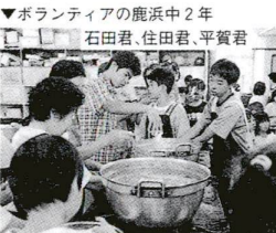
ボランティアの鹿浜中2年

大鍋2個分のすいとんが煮えるまで、戦時中のことが描かれた映画を見たり、戦争の話を聞きました。「こわねい」「かなしい」という子どもたちの声が聞こえました。戦争を体験された方も、初めて食べるという人も、平和をかみしめ、みんなで舌つづみを打ちました。