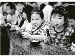
▲「ねぎはクライ」「ワタシはゴボウがニガテ」