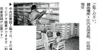
貸出中ビデオの貸出状況です。

毎日の暮らしの中で、どの家まで来るのか、今までは理していかなくてはなりませんでした。しかし世は変わり、利便性から「資源」として扱われる社会に変わっています。このビデオでは、この取り組みや、ごみ焼くこと、自分や家族の生活について、取り入れる行動がごみ減らしのきっかけとなること、暮らしを見直すきっかけとなること、ぜひご覧ください。