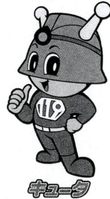
▲東京消防庁の新しいマスコット、皆さんに愛される未来消防士をイメージした「キュータ」です

毎年「地震」「火災」「がけ崩れ」などの災害で、建築物の被害だけにとどまらず、多くの人の命までが失われています。区では、建築物の防災対策を進めるために、建築物防災相談や防災査察などを行います。皆さんのご協力をお願いします。 問先 建築防災 ☎(3880) 5111(代)