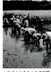
▲米づくりをみんなで体験

手作り無農薬の米作りをしながら、稲や葉についての学習、水田の生き物観察などを行います。くわしくは説明会にご参加ください。 日程：▽説明会：3月25日(日)、午後2時～4時、