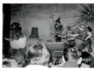
▲「バツコ」の活躍に子どもたちも大喜び

「妖霧バツコの冒険」大谷田・大谷田谷中・佐野・神明児童館共催 2月25日、4カ所の児童館共催で、「妖霧バツコの冒険」を、身近な場所で見られたという趣旨の観劇会が、辰沼小学校の体育館で行われました。開幕で、キラキラ流れるライトや美しい色とりどりのライトが照らされると、子どもたちのワーと期待の声があがりました。主人公「妖霧バツコ」の呼びかけに、子どもたちも大きな声で答えていました。幕がおりた後、「とつてもたのしかった」「バツコがね...」など子どもたちの声が続きました。