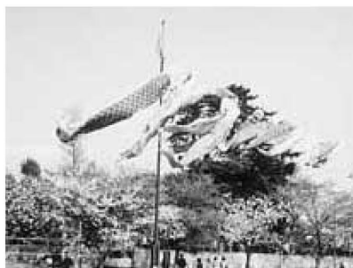
▲大門自然プチテラス(西保木門2-12)5月初旬は、シャクヤクが咲きます

平成13年度各会計予算は、3月の第1回定例会で、原案どおり可決されました。《予算課》