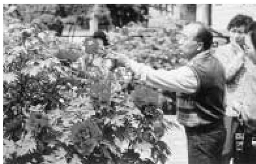
▲春の日差しの中、ぼたん園を散歩する人々

西新井大師のぼたん園では、例年より早くボタンが満開を迎えました。ボタンは、真紅、ピンク、白など子どもの顔ほ