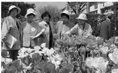
▲西新井第三団地自治会の花壇

なかには、地域の人たちで20年以上も手入れを絶やさない花壇や、3千100本のチューリップや黄色いパンジーなどで工夫を凝らした作品もあり、春の花たちで演出された花壇には、道ゆく人も足を止めて見とれていました。