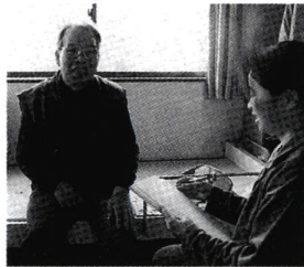
事業者を探し、ケアプランの作成を依頼。

ケアプラン(介護サービス計画)とは、介護利用者の要望や状況に合わせて立てるサービスの利用計画です。